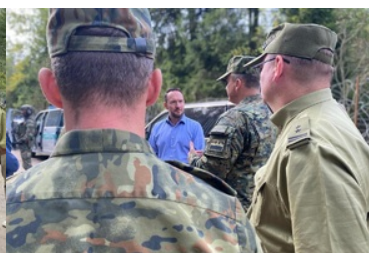
Wizyta Wiceministra, Komendanta Głównego SG na Podlasiu