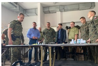
Wizyta Wiceministra, Komendanta Głównego SG na Podlasiu