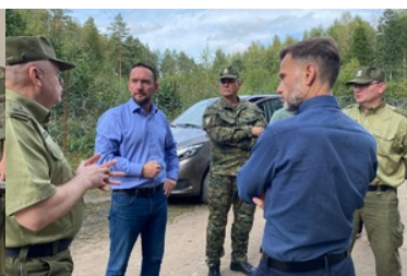
Wizyta Wiceministra, Komendanta Głównego SG na Podlasiu