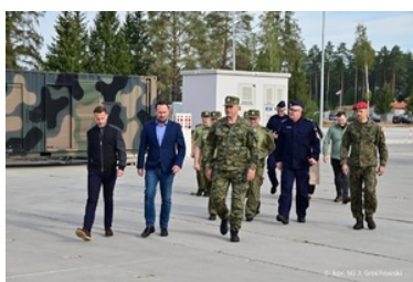
Wiceminister i Komendant Główny SG z wizytą na Podlasiu

Następnie Wiceminister Spraw Wewnętrznych i Administracji, Komendant Główny Straży Granicznej, Wojewoda Podlaski i Zastępcy Komendanta Podlaskiego Oddziału SG udali się na teren służbowej odpowiedzialności Placówki Straży Granicznej w Michałowie. Tam komendant placówki omówił bieżącą sytuację na ochranianym odcinku granicy oraz wskazał obecne zagrożenia migracyjne ze strony Białorusi.