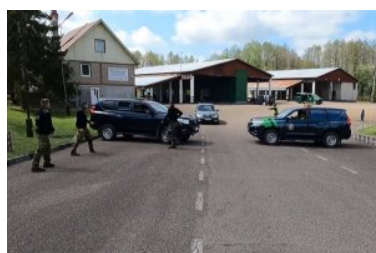
Szkolenia teoretyczne i praktyczne z taktyki jazdy oraz kontroli pojazdów i osób - wspólne ćwiczenia polskich i litewskich funkcjonariuszy SG